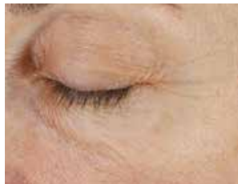
AFTER 2 WEEKS, TWICE-DAILY USE**