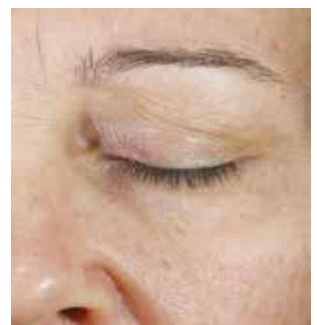
4 WEEKS TWICE-DAILY APPLICATION