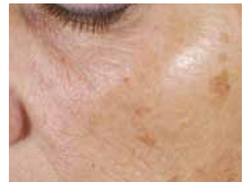
AFTER 4 WEEKS, TWICE-DAILY USE**