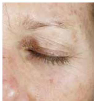
4 WEEKS TWICE-DAILY APPLICATION